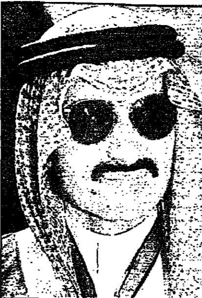
الوليد بن طلال

لندن - قدس برس: قررت خطة لإنشاء مجموعة تلفزيونية اوروبية موحدة يشارك فيها الملياردير الإسرائيلي روبرت ميروخ، ورئيس الوزراء الايطالي السابق سيلفيو بريلوسكي، والملياردير السعودي الامير الوليد بن طلال والملياردير الالمانى ليو كيرتس على الاطلاق. وأشارت اثناء تسيرت عن المؤتمر السنوي للمبيعات الذي تعده مجموعة ميديا سيت الإعلامية الإيطالية التي يديرها بريلوسكي الى ان الأخير بالاشتراك مع ميروخ والوليد بن طلال سيستثمرون ملياري جنيه استرليني، مقابل الحصول على 25 في المئة من امبراطورية الالمانى كيرتس الاعلامية الخاصة. وقال طارق بن عمار أحد مستشاري الامير الوليد بن طلال وأحد أعضاء مجموعة ميديا سيت ان المفاوضات مستمرة بهذا الشأن، وأضاف ان مجموعة كيرتس تمثل فرصة حقيقية وحيدة في أوروبا. وكان فيديلي كوناكوفيتش مدير مجموعة ميديا سيت أكد بداية الاسبوع الحالي لأول مرة ان هناك مجموعة موزونة على طولة المفاوضات، وقال كانت مجموعتنا اول فقة اوروبية تحاول بناء مجموعة تلفزيونية اوروبية موحدة في الثمانينات، ولكن الوقت لم يكن مناسباً، والان تحاول مرة اخرى.